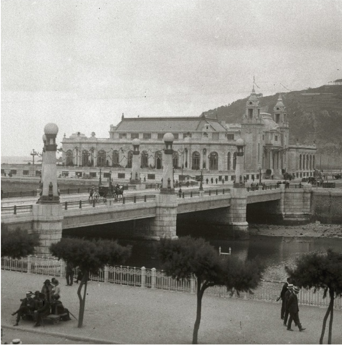
Zurriolako zubia lehen planoan; bigarren planoan, berriz, Gran Kursaal kasinoa, inaugurazio egunean, 1922ko uztailearen 29an.